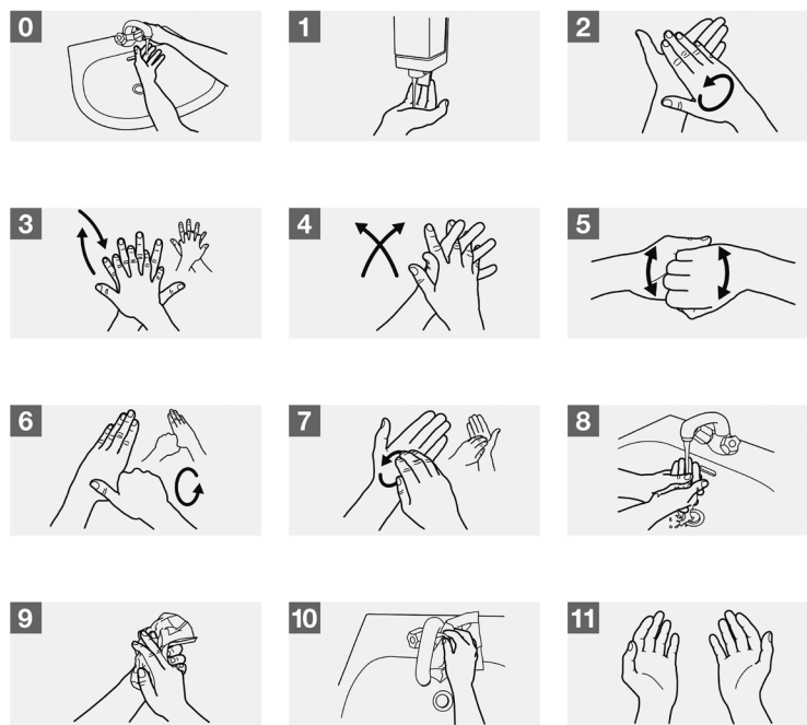
Ilustracja nr 4