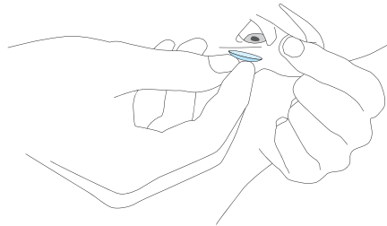
Ilustracja nr 1

Wskazówka Jeżeli soczewka kontaktowa upadnie należy ją koniecznie dokładnie oczyścić izotonicznym roztworem soli fizjologicznej (0.9% NaCl) przed ponowną próbą jej założenia. Należy uważać przy podnoszeniu soczewki kontaktowej, aby nie powstały uszkodzenia brzegów. (Nie wolno przesuwając soczewki kontaktowej po powierzchni stołu lub lustra).